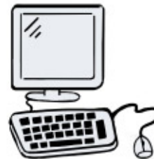
Ordinateurs et Internet